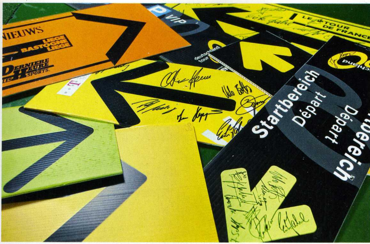
Damit fing alles an: Hinweisschilder von den Strecken großer Radrennen